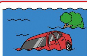
台風・洪水・竜巻・ 高潮等