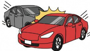
他のお車との 衝突・接触