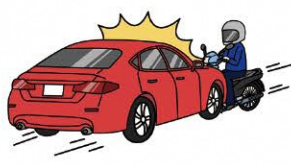
二輪自動車・ 原動機付自転車との衝突