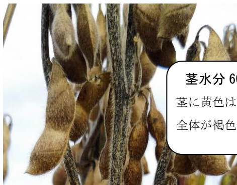
図2 収穫作業に適した茎水分判定のめやす