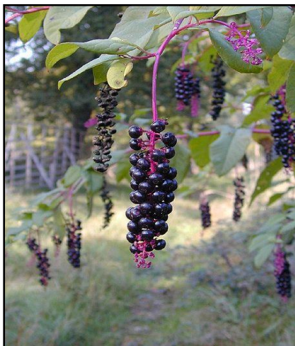
(ヨウシュヤマゴボウ：赤色)

特に、ヨウシュヤマゴボウ、イヌホオズキの果実汁には毒性があるため、果実汁が付着した粒が製品に混入すると、農産物検査の対象外となるので注意する。