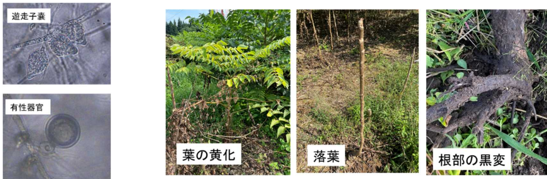
図1 タラノキ分離株の形態

注1: 浅利ら(1986)の報告、注2: タラノキへの病原性はワグネルポットを用いた栽培試験で実施、地上部が枯死し、根が水浸状で軟化したものを○(陽性)とした。注3: タラノキ立枯疫病菌(MAFF240271)のrDNA-ITS領域との相同値、注4: 未試験