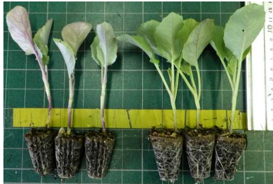
図1 スーパーセル苗および慣行苗の形状