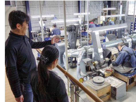
市内企業で進むオープンファクトリー