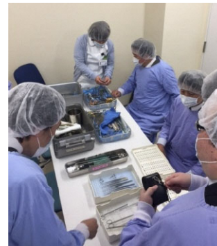
燕市医療機器研究会の活動