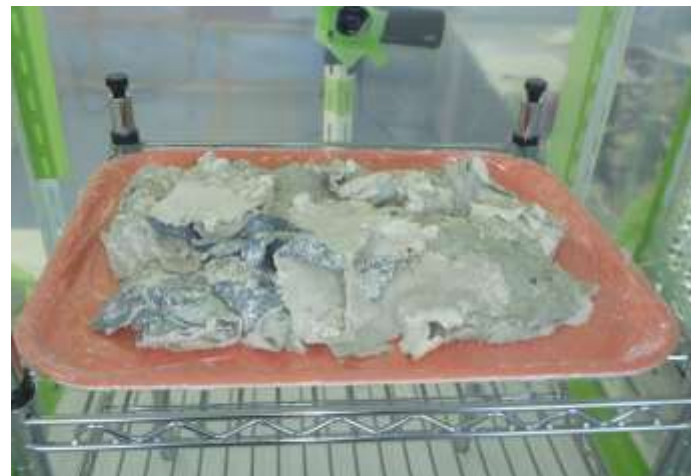
(2) 剥離剤併用により 除去されたもの