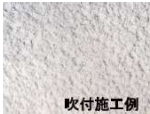
石綿含有仕上塗材