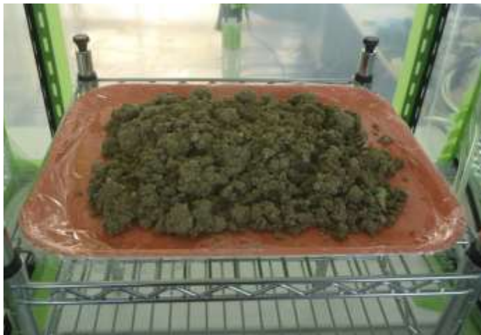
(1) 高圧水洗工法により 除去されたもの