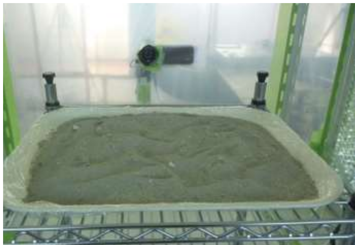
(3) グラインダーケレン工法 により除去されたもの