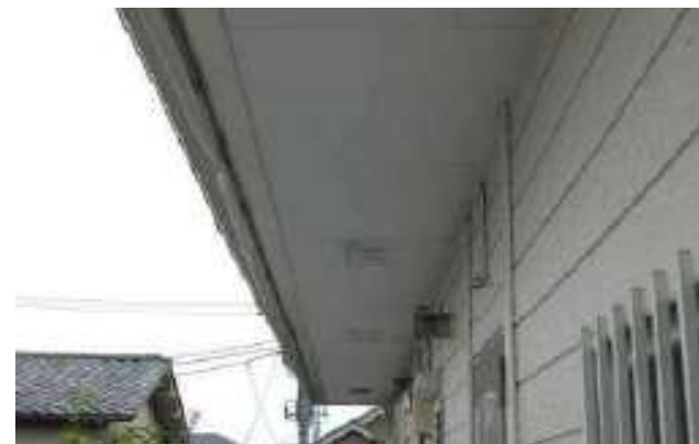
けい酸カルシウム板第1種