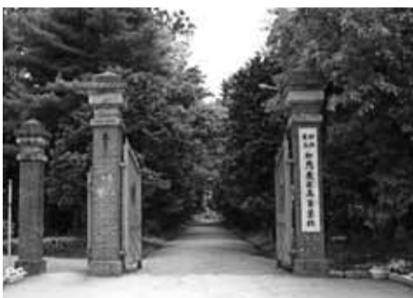
加茂農林高等学校

今後は、農業の6次産業化を見据えて、農産物の生産・加工・流通を有機的に結びつけた学習を充実させるとともに、農業高校の拠点校として、将来、地域産業を支える人材育成に向けた教育に取り組んでいく。