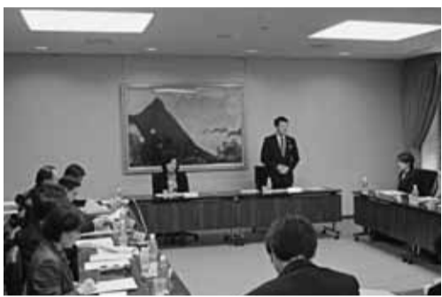
人口問題対策会議

問 原子力規制委員会は避難計画の策定に直接関与せず、国は地元自治体に策定を丸投げしている中、九州電力川内原子力発電所は再稼働に突き進んでいる。避難計画を誰も審査しておらず、安全性が十分に確認できないまま、経済産業大臣は、「事故が起きた場合は、国が責任を持って対処する」と述べているが、具体的な内容は見えていない。この「国が責任を持って対処する」との言動に対し、どのような認識を持っているか伺う。