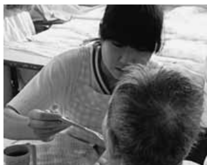
職場体験活動の様子

ころである。今後、その意義を伝えることなどを通して、実施日数の延伸を働きかけていきたいと考えている。