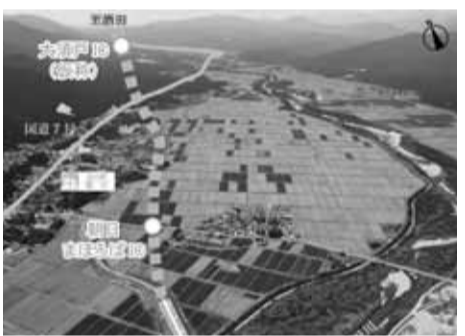
朝日温海道路(朝日まほろばIC)