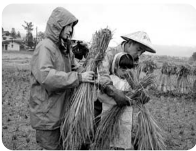
農業体験(南魚沼市)

健康づくりの内容を取り入れたグリーン・ツーリズムのメニューについては、新たに医療・福祉・健康産業おこしのため、外部から採用する人材の知恵も活用しながら検討していきたい。