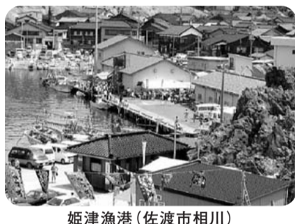
姫津漁港(佐渡市相川)

離島漁業再生支援交付金制度は、離島漁村の再生を図るため、漁場生産力の向上や集落の創意工夫を生かした取組を支援する制度。