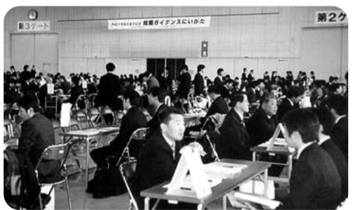
新規学卒者就職ガイダンス(新潟市)

※二ノトは学校卒業後で仕事も職業訓練もしていない未成年で家事育児・通学をしていない15・34歳の若年者。