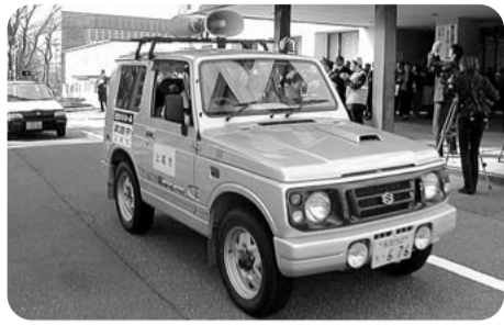
上越市での自主防犯パトロール車の出発式(4/5)

地域住民等による自主防犯活動において、視認性が高く、防犯効果もある青色回転灯を装着した自主防犯パトロール車の運用は、極めて効果があると考えられるので、自治体や防犯ボランティア団体等に積極的に活用されるよう、働きかけていきたい。