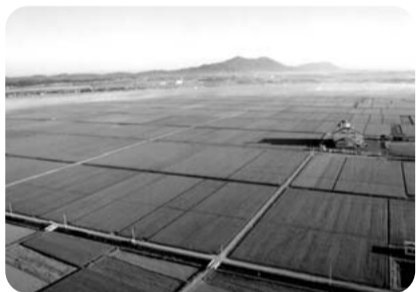
ほ場整備された水田(長岡市)

本県農業が魅力的で活力ある産地づくりを進め、国内外の産地間競争を勝ち抜くためには、利益が出る農業を想定し、それに相応した農業生産基盤を整備することが重要と認識している。農家の取り組み意欲が増すような事業を優先的に執行し、事業効果の早期発現に努めていきたい。