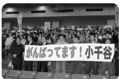
被災した方々を勇気づけたプロ野球の招待試合(平成17年3月 東京ドーム)

スポーツは、心身の健全な発達、体力向上や青少年の健全育成、高齢者の生き甲斐づくり等、様々な社会的・教育的な機能を有するとともに、人間性向上にも大きな役割を果たす文化的価値を持つものと考えている。中越大地震においても、サッカー日本代表の試合やプロ野球の招待試合など、様々なスポーツチームや選手が試合等を通じ被災された方々を勇気づけたが、県民が元気をだして復興に取り組んでもらうためにもスポーツの意義は大きいものと認識している。