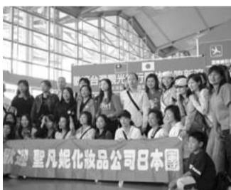
台湾からの観光客ツアー (平成17年9月 新潟空港)

台湾からの観光客のチャーター機増加への対応や、国内遠隔地からの空港利用者の取り込みを行うため、旅行代理店等が借り上げるバス費用に補助を行います。