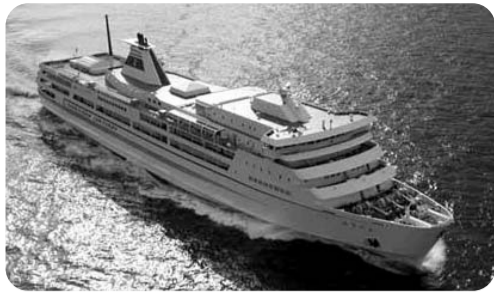
佐渡汽船おけさ丸

外国人向け観光パンフレットの充実が必要ではないか 外国人に本県への観光旅行を働きかけるためには、自然、食などの新潟の魅力のアピールし、関心を持ってもらえる工夫が必要である。現在、英語、韓国語、中国語で作成されている誘致パンフレットの内容の充実とその効果的な配布が有効と考えるが、所見を伺う。