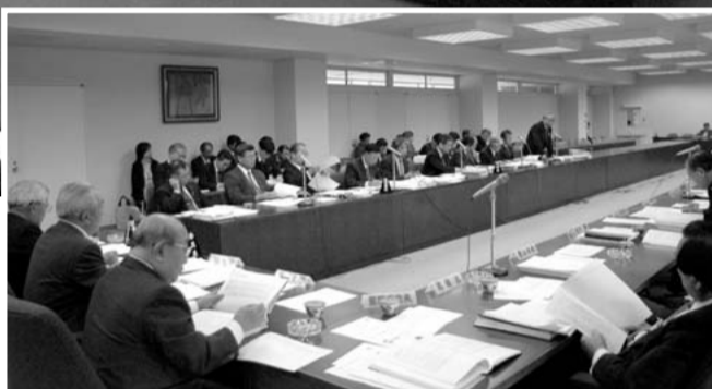
企業会計決算審査特別委員会 (10月24日) 写真右