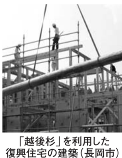
「越後杉」を利用した復興住宅の建築(長岡市)

また、にいがたブランド材「越後杉」を活用した被災地の住宅再建が進んでいることから、森林組合等への一層の助成を行います。