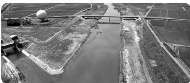
改修工事が行われた能代川と荻首根川の合流点

答 これまで全ての県有施設の調査を行った。現時点で吹き付けアスベストの露出が確認されたのは9施設11棟である。これらの施設及び今後の分析調査で新たにアスベストの含有が確認された施設については、早急に除去等の対策を講ずる。