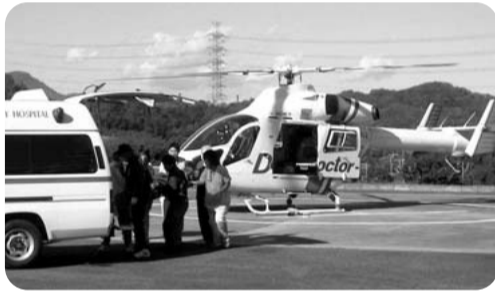
ドクターヘリによる患者の搬送

答 救命救急センターを対象とした救急患者搬送体制の強化を目的に、平成13年度に国の補助事業として、ドクターヘリ事業が創設され、現在、9道県の10病院でこの制度が活用されている。 離島や多くの中山間地を抱える本県でも、ドクターヘリの導入は、救命率の向上などに有効な手段の一つとして考えられるが、現時点では、敷地内にヘリポートを有する救命救急センター