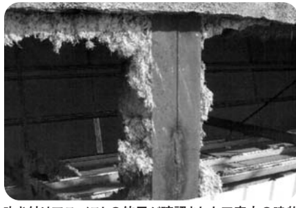
吹き付けアスベストの使用が確認された工事中の建物

査を実施しており、9月15日現在、206施設で吹き付けアスベストが露出しているとの回答があった。現在、所有者等に対し、飛散防止対策の必要性の啓発と早期対策を講ずるよう指導している。 市町村有施設は、11月中旬にとりまとめる予定で調査中であり、現時点でアスベスト含有の可能性のある吹き付け材の露出が約400施設で確認されている。対応として市町村担当課長会議の開催やアスベスト対策に関する通知等で助言している。