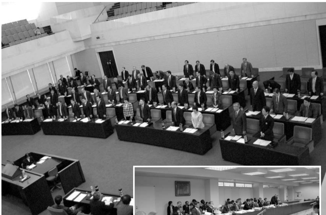
9月定例会最終日の本会議 (10月14日) 写真上

○財政運営計画(素案)をはじめ、震災復興、アスベスト問題等に幅広く議論を展開 ○災害からの復旧・復興、危機管理対策の徹底を図る経費など、総額約134億円の一般会計補正予算を可決