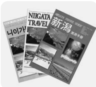
外国人向け観光パンフレット

県では、スキーや雪景色など雪国の魅力、四季ごとの景観の美しさ、新鮮な山海の食や豊富な温泉などを前面に打ち出したパンフレットを作成しているが、それぞれの国の観光旅行者が興味を示す内容も盛り込む必要があると考えている。また、配布については、海外での観光プロモーションにおいて、観光展への来館者やエージェンツの商品開発責任者など、外客誘致に直接効果のある相手方への配布に努めている。