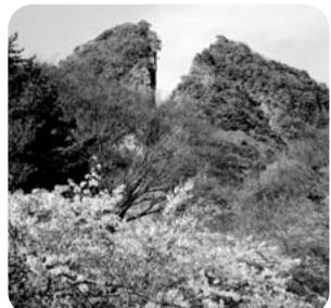
佐渡金山 道遊の割戸

佐渡金山遺跡は、県民が郷土への誇りと愛着を持ち、活力に満ちた地域づくりを進める上で大きな希望と自信を与えるものと考えている。世界遺産登録に向けて、県のより積極的な対応が必要と考えるが、所見を伺う。