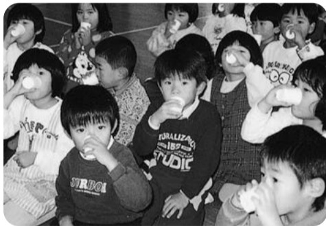
子供たちのフッ素洗口

小学校以外は半数に満たない実施状況にあることから、引き続き、県教育委員会や県歯科医師会等と連携し、市町村や保護者に対しフッ素洗口の有効性・安全性の情報を提供するなど、さらなる推進に向け、積極的な働きかけを行っていききたい。