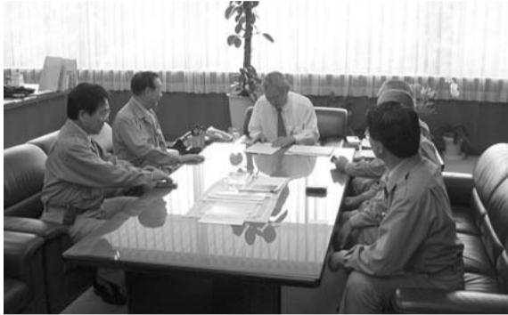
正副議長及び正副常任委員長が 国の関係省庁への要望活動を実施 (国土交通省にて 7月26日)