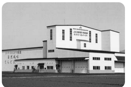
コスト削減の基幹施設となるカントリーエレベーター

コスト削減は、本県の喫緊の課題。これまで担い手への農地集積、カントリーエレベーターなど基幹施設を核とした生産体制構築等に取り組む、着実なコスト低減が図られたが、他県と比べると依然として高い状況にあることから、今後とも生産組織の協業化や法人化等による経営体質強化等コスト低減対策への積極的取組が必要と考える。