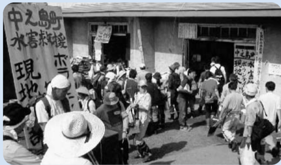
ボランティアの受入れ 中之島町

現在、県では、平常時から関係団体との連携を図るための「県災害救援ボランティア活動推進組織」の設置準備を進めており、災害救援ボランティア現地本部設置マニュアル作成など、被災地市町村での迅速な対応ができるよう支援することとしている。