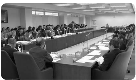
企業会計決算審査特別委員会の審議

11/30には、知事に対する総括質疑、12月定例会中に付託議案の委員会採決、本会議における委員長報告を経て、平成15年度一般会計等決算議案が採決される予定です。