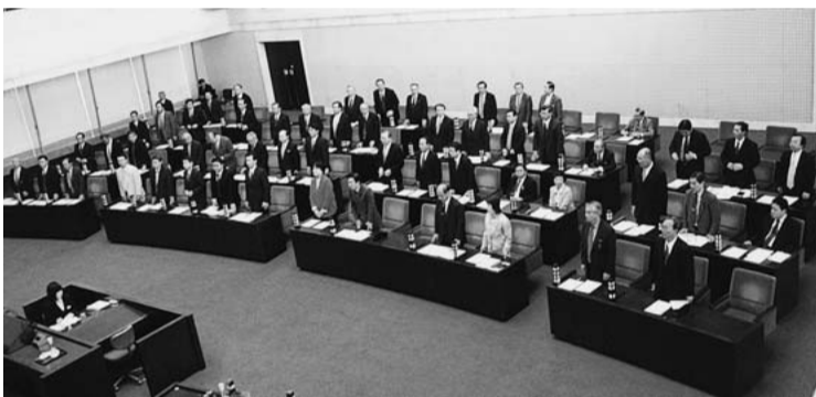
災害復旧費や朱鷺メッセ連絡デッキ復旧への 設計費などを含む一般会計補正予算を可決 (本会議 9月27日)