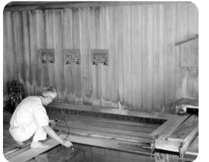
県の温泉実態調査

今回の調査結果を踏まえ、温泉施設に対する監視の強化や、温泉関係者への関係法令の主旨の徹底を図るとともに、温泉情報の積極的な提供を促すなど、再発の防止と信頼の回復に向けた指導を行っていききたい。