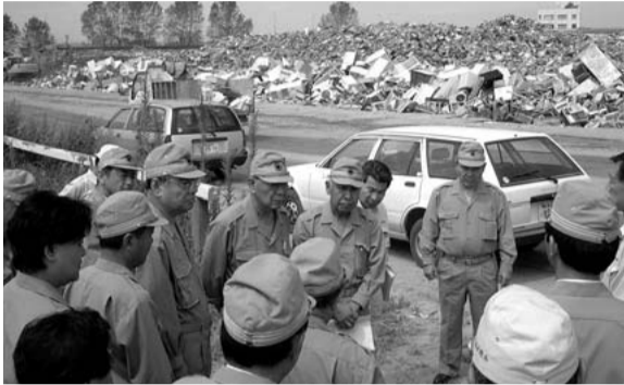
常任委員会 被災地を視察 (ゴミ集積場となった三条競馬場跡地を視察 厚生環境委員会 8月4日)