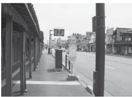
無電柱化された道路(一般国道352号)

また、道路の中期計画については、素案は国民各層や各都道府県知事等の意見を踏まえて作成されていることから、今後はこの計画に基づき道路整備を着実に進めたいと考えている。