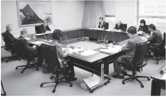
政策プラン評価委員会

※新潟県「夢おこし」政策プラン これまでの新潟県長期総合計画に代わり、「将来に希望の持てる魅力ある新潟県の実現」を基本理念とした、新しい県の最上位の行政計画。