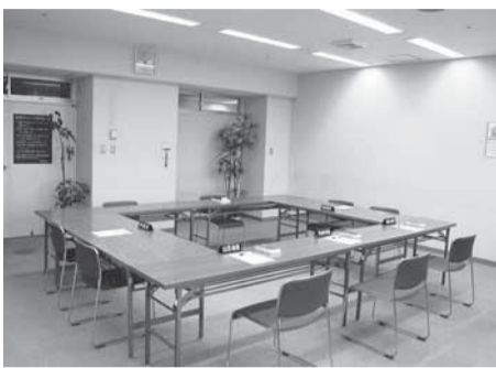
個別労働関係紛争あっせん会場