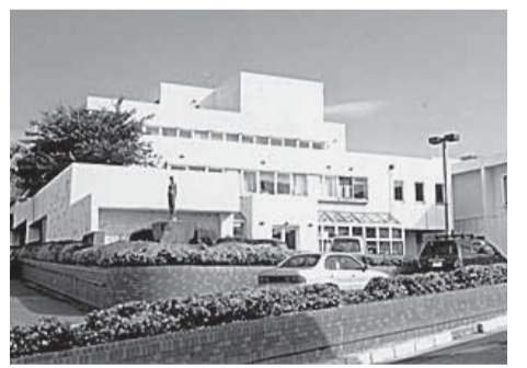
はまぐみ小児療育センター

また、現在「発達障害者支援体制整備検討委員会」を設置し、支援体制の充実強化について検討しているところであり、今後その結果を踏まえて、望ましい支援体制を構築していきたいと考えている。