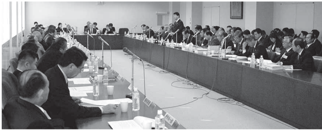
普通会計決算審査特別委員会 (11月30日)