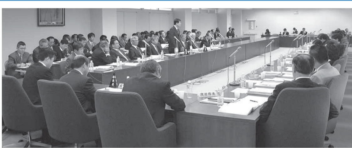
企業会計決算審査特別委員会 (11月27日)