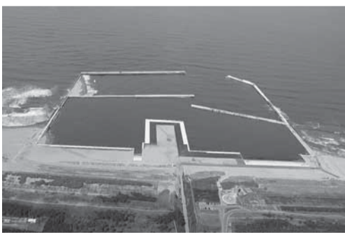
南浜地区小型船だまり