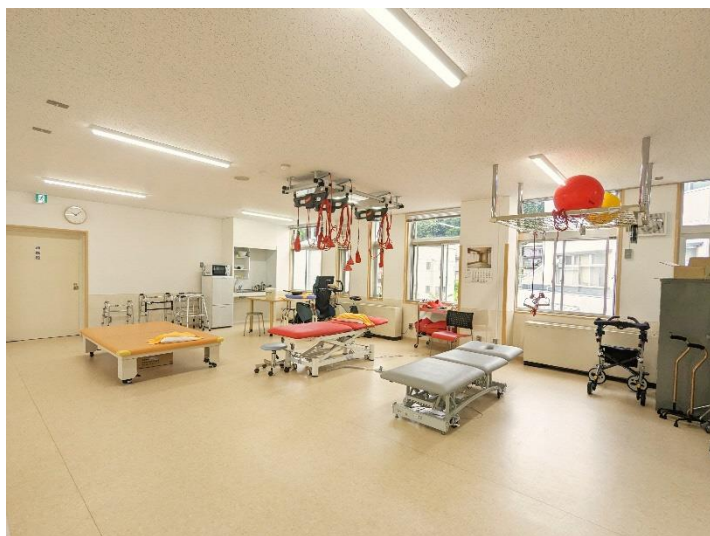
▲リハビリテーション用の専用器具が並ぶ