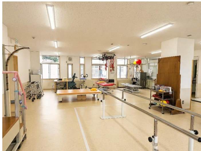
▲コンクリート壁を撤去してワンルームに

リハビリテーション用の専用器具も、ミニキッチン、レッドコード、オーバーヘッドフレーム、回旋運動器、運動梯子などを新設し、従来よりも患者さんの機能訓練の充実が図られるよう配慮した備品内容となっています。