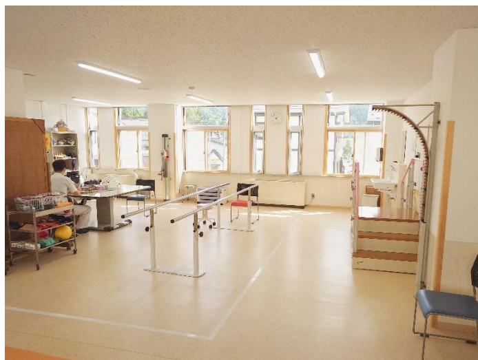
▲室内は白を基調に、明るさを感じられるよう配慮