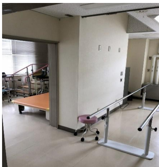
▲拡張整備前の旧リハビリテーション室

このため、急性期治療を経過した患者さんや在宅療養を行っている患者さんを受け入れ、在宅復帰を支援する役割を担う地域ケア病床への転換を行うこととしました。