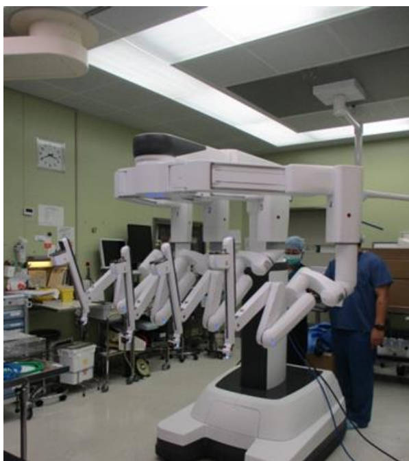
▲がんセンターに導入されたダビンチ(ロボットアーム部分)

また、都道府県がん診療連携拠点病院のトップとして、県内のがん診療連携拠点病院等との連携体制の強化を図り、本県のがん医療の向上に貢献いただきました。