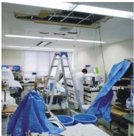
▲令和4年8月3日からの大雨による被害に対応