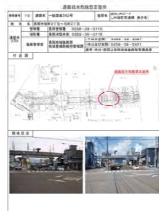
冠水想定箇所台帳