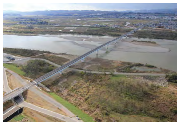
一般国道404号 フェニックス大橋 (長岡市)