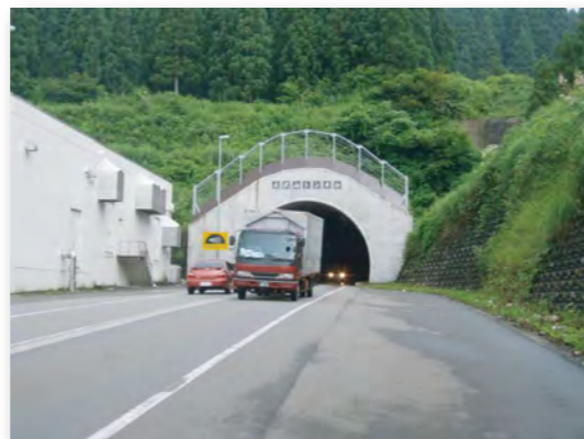
主要地方道十日町当間塩沢線 大沢山トンネル (十日町市~南魚沼市)