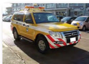
道路パトロール車

県内にある 12 の地域整備部、津川地区振興事務所及び 3 維持管理事務所の職員等が道路交通の安全を確保するため道路パトロール車で巡回し、危険箇所の発見や道路の不法占用などの取り締まりをしています。また、道路の現況を把握する資料として各路線ごとの道路台帳と台帳附図を備えています。