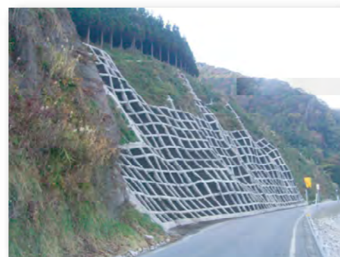
主要地方道 佐渡一周線（佐渡市）

魅力あるまちづくりの取組として、道路除草や植栽などNPOや地域住民との協働が進んでいます。こうした地域主体の沿道環境整備を支援しています。