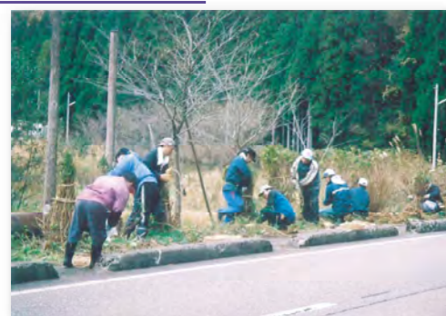
一般県道 上正善寺高田線（上越市）

魅力あるまちづくりの取組として、道路除草や植栽などNPOや地域住民との協働が進んでいます。こうした地域主体の沿道環境整備を支援しています。