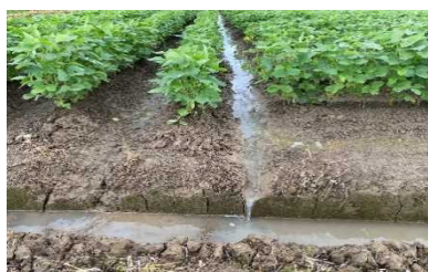
図3 畝間を周囲明渠に連結