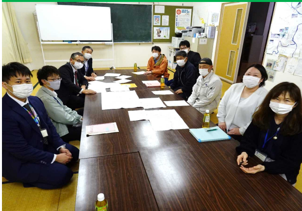
検討委員会での話し合いの様子