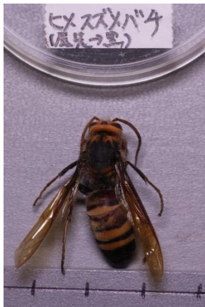
ヒメスズバタ (風見草)