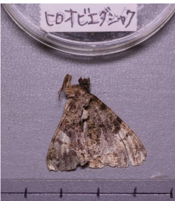
ヒトヒエダシヤク