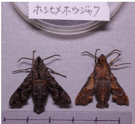
ホシメホウジャク