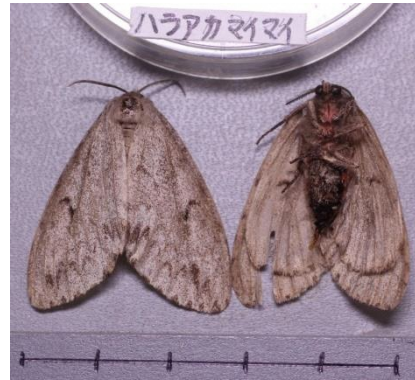
ハラアカマイマイ