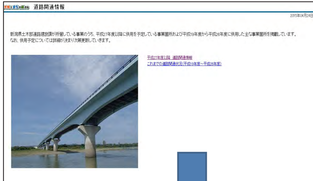
平成27年度以降 道路開通情報 これまでの道路開通状況(平成19年度～平成26年度)

新潟県土木部道路建設課が所管している事業箇所のうち、平成27年度以降に供用を予定している主な箇所を公表しています。