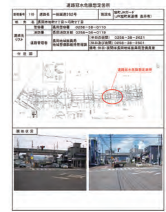
冠水想定箇所台帳