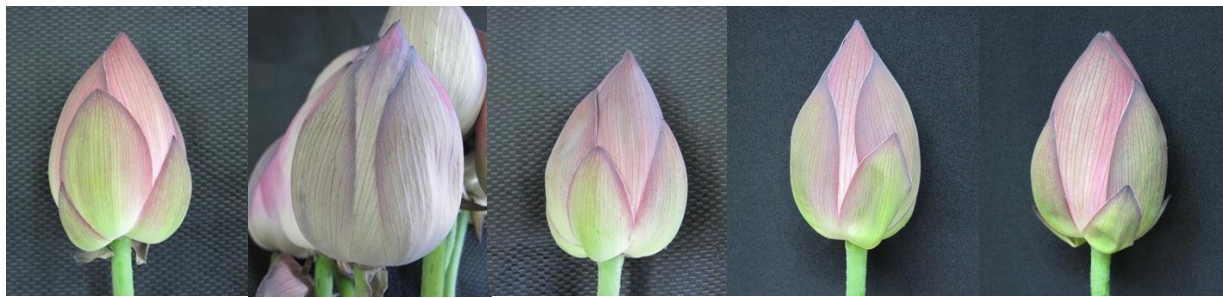
採花時 湿式:常温(27~32°C) 4日間 湿式:10°C 6日間 乾式:5°C 5日間 乾式:10°C 5日間