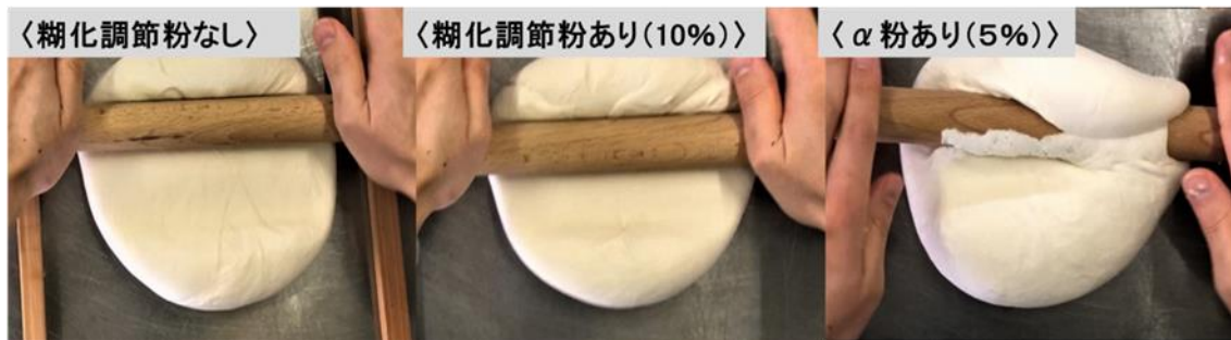
図2 生地成型時の作業性