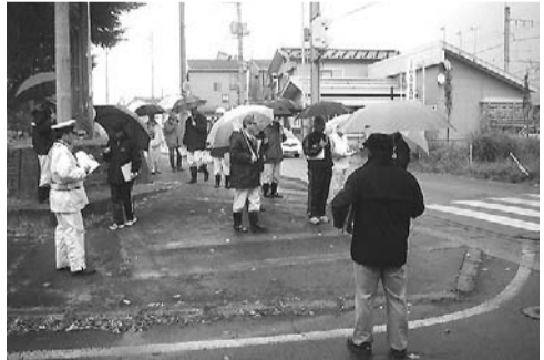
通学路の安全点検の様子

南魚沼市をはじめ県内各地で実施されている通学路の安全点検は、交通事故防止に加え防犯上にも効果を上げていることから、今後とも地域と一体となつた交通安全対策を一層推進していきたいと考えている。