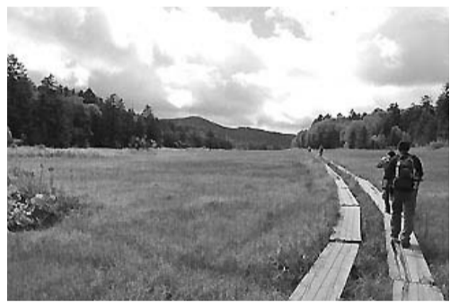
尾瀬のハイキングコース

年」と位置づけ、官民一体となって、本県の魅力を発信し、より多くの方々から訪れていただくような取組を進めている。