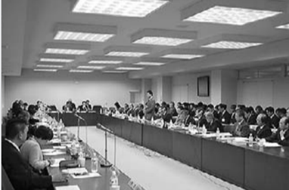
決算審査特別委員会

各委員会は、付託された各決算議案について、12月定例会までの閉会中に審査を、12月定例会中に採決を行いました。