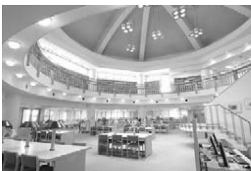
今年4月に開学する新潟県立大学(図書館)

答 環日本海諸国から留学したくなる大学、卒業後は新潟県に恩返ししてくれるような大学を目指すべきとの意見には、私も全く同感である。県立大学には、東アジア交流の担い手として、本県発展のために活躍してくれる人材を多数輩出することを期待している。