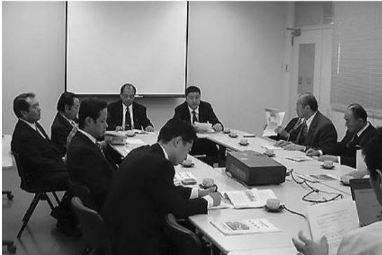
東日本高速道路株式会社村上工事事務所(村上市)を視察(11月13日)