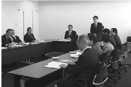
妙高市議会(妙高市)を視察(11月12日)