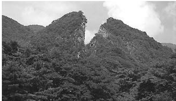
佐渡金銀山「道遊の割戸」