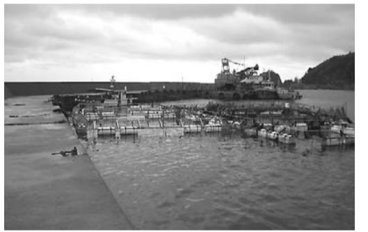
佐渡の蓄養施設(水津いけす)