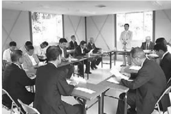
石打丸山シャンツェ(南魚沼市)を視察(8月25日)