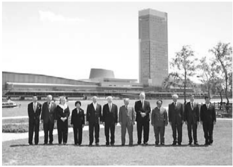
©2008 Ministry of Health, Labour and Welfare, Japan, All Rights Reserved. G8労働大臣会合(G8閣僚らとの記念撮影)

答 コンベンションの企画・運営を行う県内の企業や人材が、ノウハウを蓄積し、企画力を向上させることが、大変重要であると考えている。今後とも、企画・運営力の強化などに必要な支援を行っていききたいと考えている。