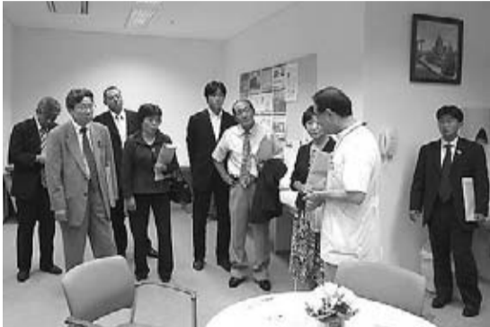
県立新発田病院(新発田市)を視察(8月28日)