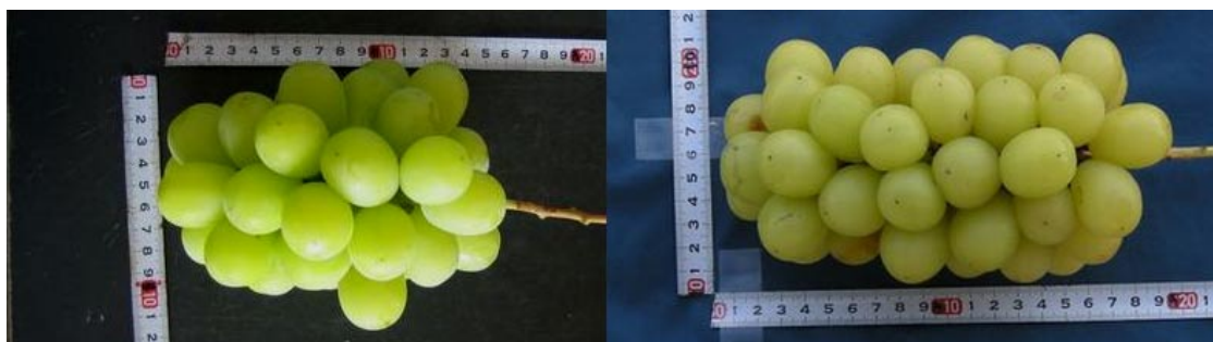
花穂整形時 3.5cm 果房重 505g、着粒数 40、粒重 12.5g 花穂整形時 5.0cm 果房重 613g、着粒数 55、1粒重 11.1g