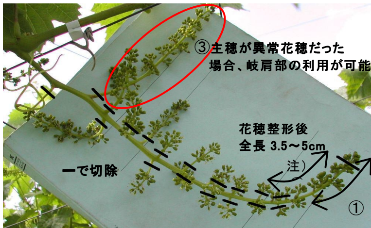
図1 種なし栽培における花穂整形方法