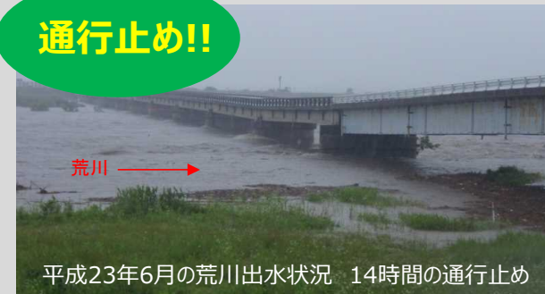
平成23年6月の荒川出水状況 14時間の通行止め