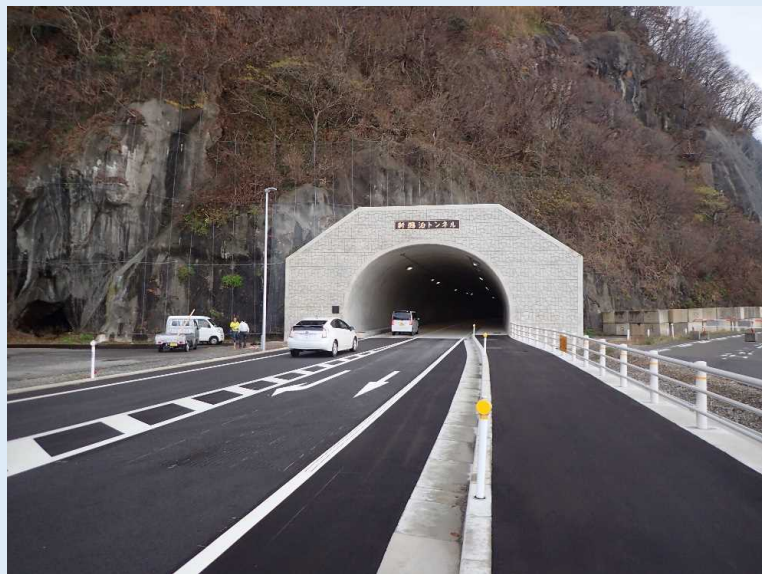
新鵜泊トンネルの開通により、安全で円滑な交通を確保