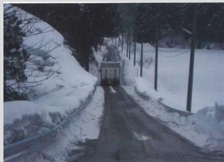
荒沢から小須戸方面の現道