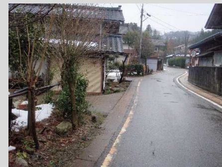
小須戸地内の現道