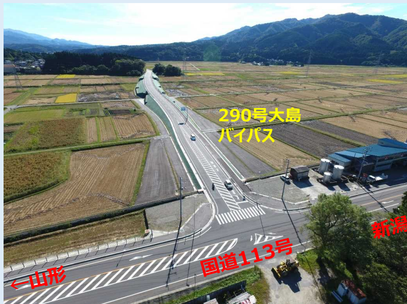
道路が完成し、H30.9.19に供用開始