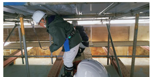
視察状況 (ゲート内部)