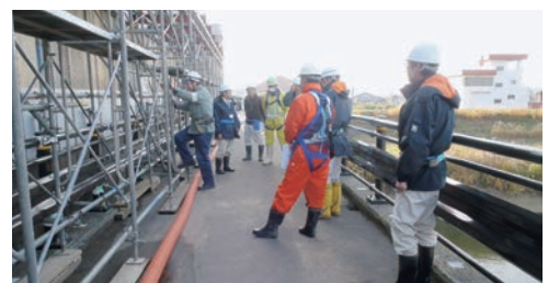
視察状況 (ゲート外部)

様々な視点からの指摘や参考情報を活用し、事故なく無事に完了できるよう残りの工事を十分注意しながら実施していきます。