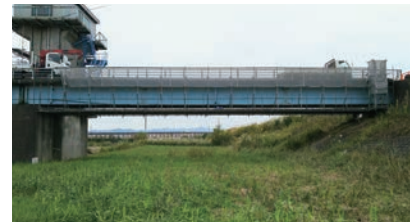
管理橋仮設足場設置状況

このため、狭い作業環境での工事となりましたが、河川を締切りせずに実施することができました。