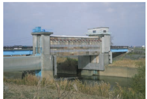
ゲート補修仮設足場設置状況