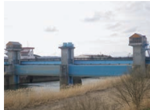
完了 左側 (H29施工) 右側 (H30施工)