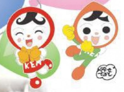
人権イメージキャラクター 人KENあゆみちゃん、人KENまもる君