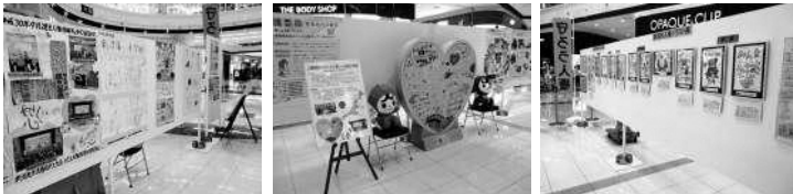
※写真は昨年度の様子です。