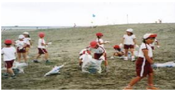
小学生もゴミ拾いに協力しています。