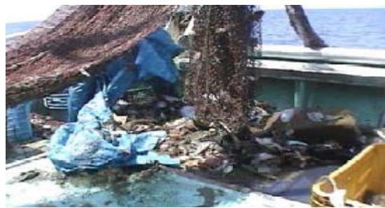
漁師さんは海底清掃を行っています。 ビニールシートまで入ってきます。