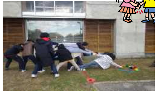
＜みんなで助け合う妙高アドベンチャー＞

・最初は、参加するか帰るか迷っていたけど、他の人とたくさん話をする事ができて、参加してよかったと思った。