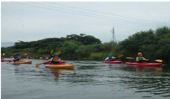
＜カヌーをこいで気分爽快！＞

・はつらつ体験塾での活動は、普段できないような野外でのクッキングやカヌーなどの体験ができるから楽しい。