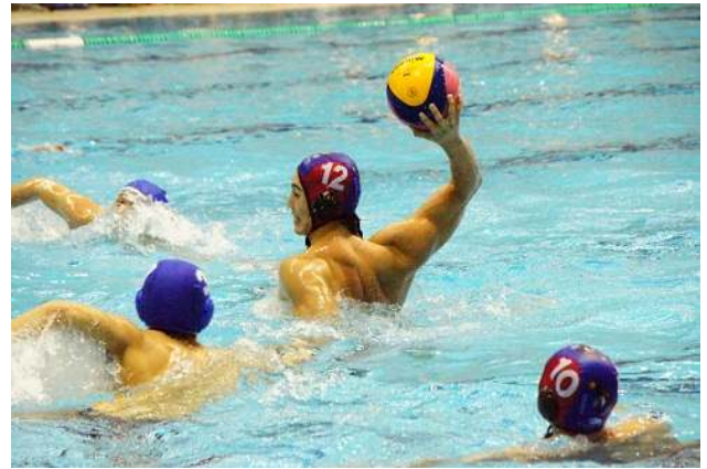
県内競技者の活躍の様子