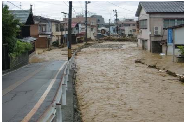
豪雨による被害の様子