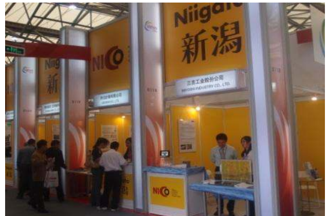
中国における販路拡大のための新エネルギー関連製品展示会の様子