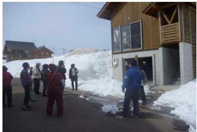
移住検討者に対する現地説明会の様子