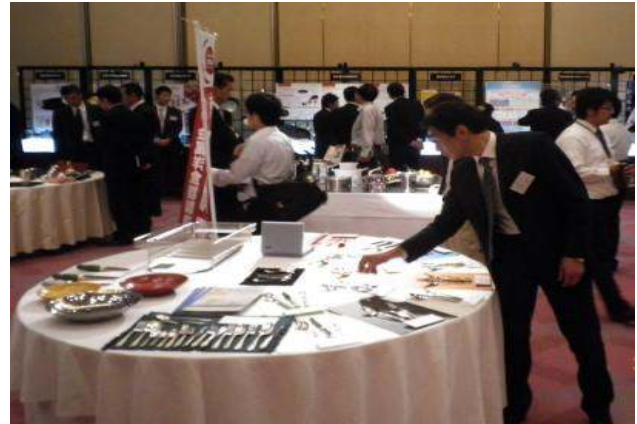
燕三条地域における金属ハウスウェア製品の商談会の様子