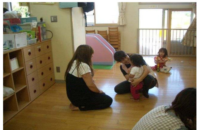
未満児保育の様子