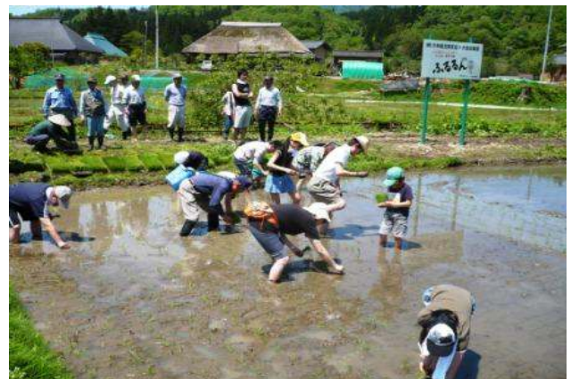
田植え体験を通じた中山間地域と企業の交流活動の様子