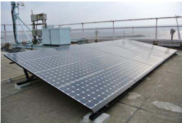
粟島における新エネルギー導入推進のための活用技術の実証の様子

災害に強いエネルギー供給システムの構築に向けた取組や、成長が期待される新エネルギー産業分野への県内企業参入を促進し、新潟県の経済成長を担う産業を創出・育成する取組に活用させていただきました。