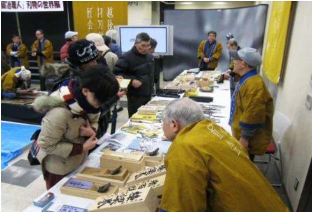
首都圏における打刃物の販売会の様子

地場の中小企業の経営安定及び新たな需要創出を図るため、商工団体等が行う販路拡大に向けた事業を支援する取組に活用させていただきました。