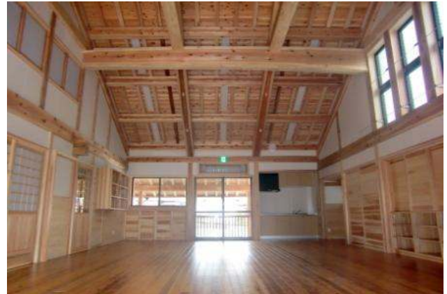
県産材で整備された保育園の様子