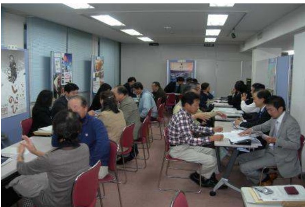
首都圏における移住検討者に対する 相談会の様子

県外在住者との交流や県外からの移住を促進するため、新潟の魅力、暮らしやすさなど、健康的で豊かな「にいがた暮らし」の情報発信や、市町村、関係団体と連携した取組に活用させていただきました。