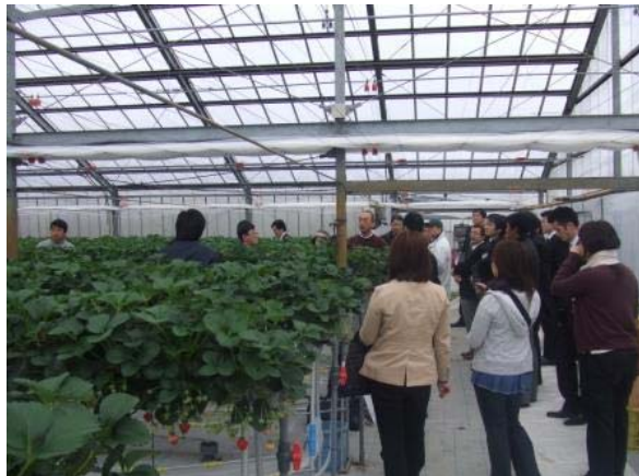
ハウス見学の様子