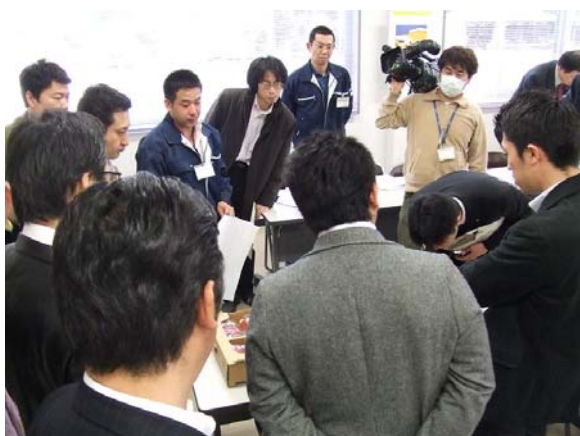
産地 J A による説明

今年度は、夏と秋に他のブランド品目について、産地見学ツアーの開催を予定しています。生産者や関係者の皆様は、旬の時期でお忙しいと思いますが、産地を P R する絶好の機会。積極的なご協力をお願いします！