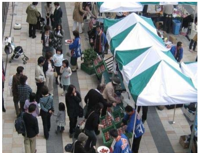
マーケットの様子

販売も好調で、なかには連日2パック以上購入されたお客様もいらっしゃるなど、当初予定を大幅に上回る販売実績となりました。