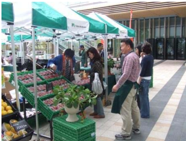
お客様に説明する販売スタッフ

今回、試食・販売された越後姫は、食味、風味、形状、堅さや酸味のトータルバランスがとれたもので、いずれも大玉。産地が自信を持って送り出した品ばかりです。