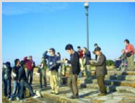
H19 みなまた環境大学