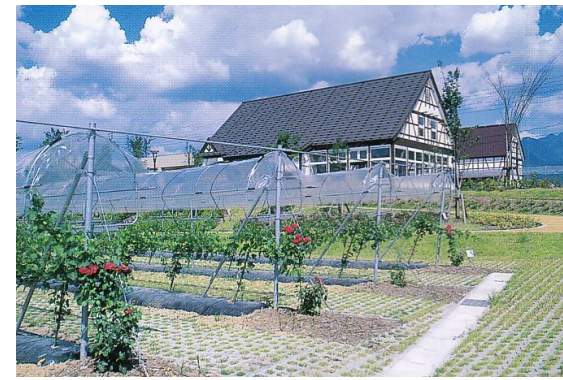
垣根仕立てレインカット方式の葡萄栽培、レストラン「葡萄の花」