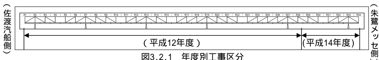
図3.2.1 年度別工事区分

斜材ロッドの配置の変遷を表3.2.1及び図3.2.2で示す。斜材ロッド定着部の形状の変遷を表3.2.2で示す。