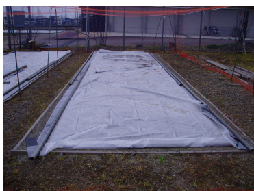
図1 露地プール育苗の様子