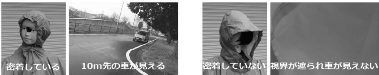
写真 フードによる視界遮断の例

周囲を確認する際に、フード調節機能を正しく使用しないと、左右の視界が遮られることがあります。