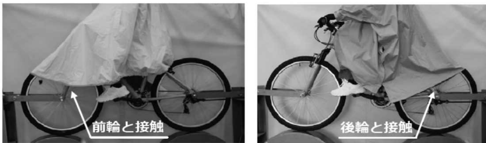
写真 車輪に接触した例