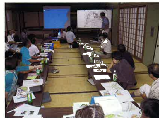
ワークショップ状況