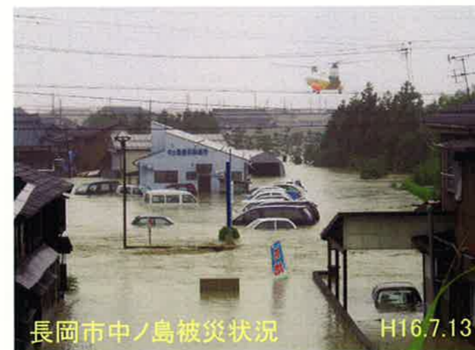
長岡市中ノ島被災状況