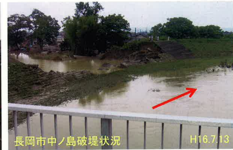
長岡市中ノ島破堤状況