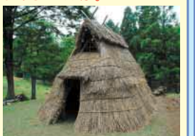
斐太遺跡群・竪穴式住居