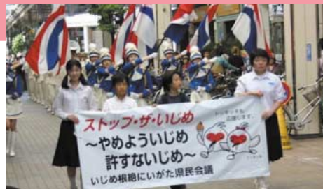
「ストップ・ザ・いじめ」パレード

いじめ問題に県民全体で取り組むため県内各界の幅広い約50の機関・団体で県民会議を構成し、いじめ根絶に取り組みます。主な取組として、いじめ根絶スクール集会の開催や懸垂幕掲示の推進等、いじめ根絶の啓発活動を行います。