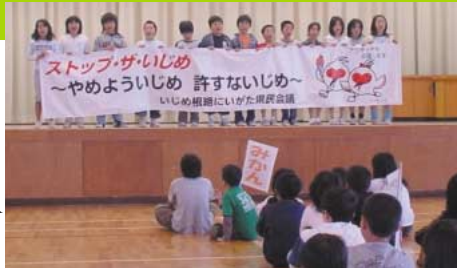
外ヶ輪小学校の児童集会