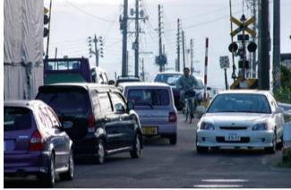
稲葉踏切の通勤時間帯の状況▶

稲葉踏切によって市街地が分断され、道路の幅が狭く車両のすれ違いも困難なため、周辺で慢性的な渋滞が発生!