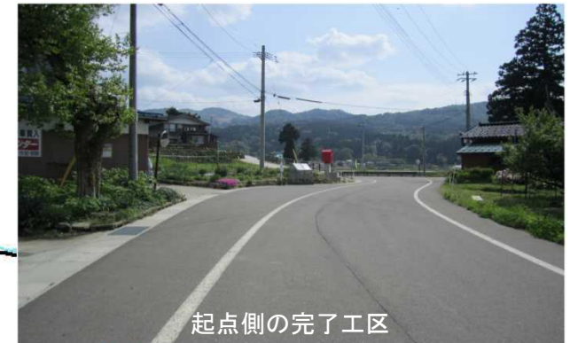
起点側の完了工区