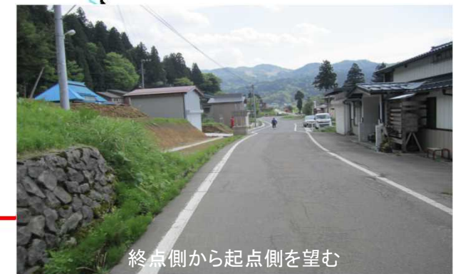
終点側から起点側を望む