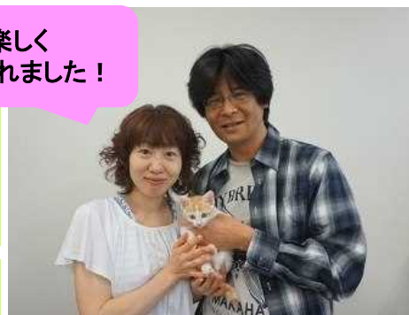
平成28年度ミルクボランティアさん