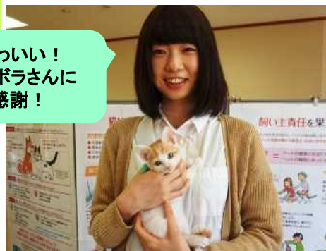
ミルクさんに育てていただいた 譲渡猫、第1号です！