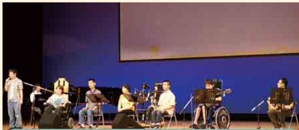
県立柏崎養護学校高等部 バンド演奏 「社会の中でつながりを大切に生きていこう。いっしょに。」