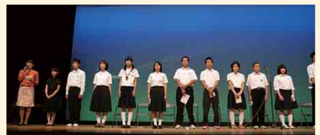
大切なあなたへ伝えたい言葉 「家族へ、仲間へ、自分の育った地域へ、ありがとう。」

人と人との絆を実感することにより、子どもたちの社会性がはぐくまれていきます。県内の小・中学校では、連携して社会性をはぐくむための検討を行い、異年齢交流活動や様々な体験活動、「こんな時どうすればよいか」というスキルを学ぶ学習などに取り組んでいます。学校からの働きかけに加え、家庭・地域での様々な体験により、子どもたちの社会性がはぐくまれていきます。