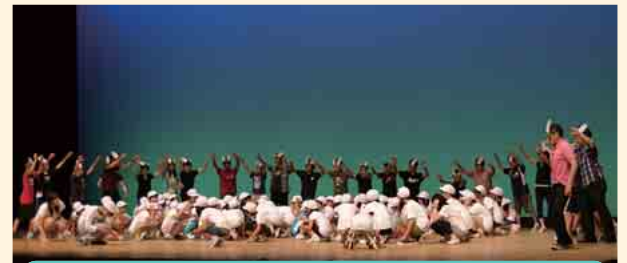
新潟市立内野小学校・新潟大学教育学部 音楽劇 「みんなのためにできることを考えよう。」