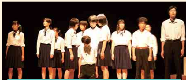
県立新潟南高等学校 演劇 「人と人のコミュニケーションで大切なことは何だろう。」