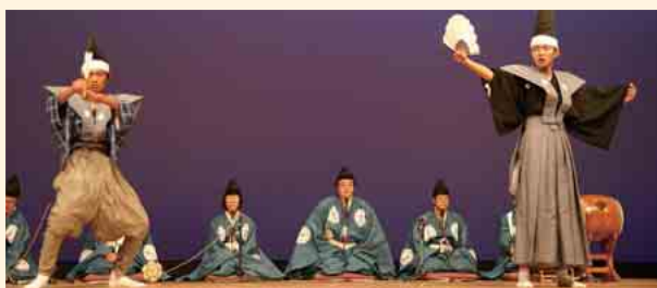
柏崎市伝統芸能 綾子舞 「地域の方から教えられたことはたくさんあります。」