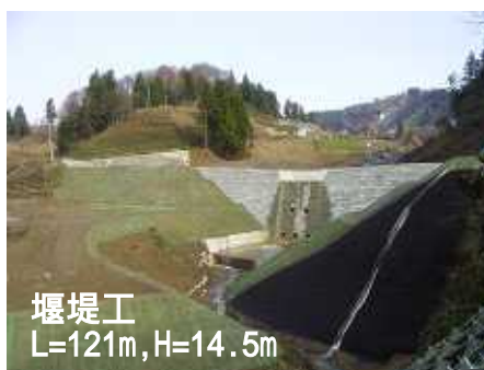
堰堤工 L=121m, H=14.5m