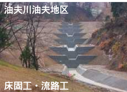
油夫川油夫地区 床固工・流路工

最後に、災害発生以来これまで御支援・御協力をいただきました関係機関並びに地域の皆様に、心より感謝し御礼を申し上げます。