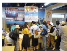
ネスパスイベント

なお、同ビデオ製作費は「ことりっふ製作」に係る復興基金の立替払いに充てさせていただきました。