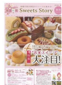
スイーツストーリーブック