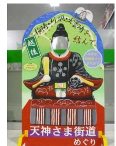
天神様めぐり 顔ハメ看板