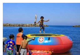
ビーチピクニック2017