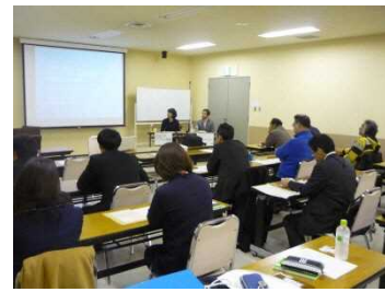
観光セミナー風景