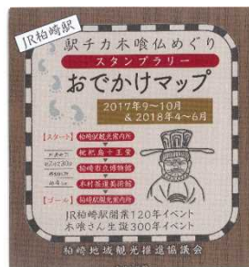
駅チカ木喰仏めぐり おでかけマップ