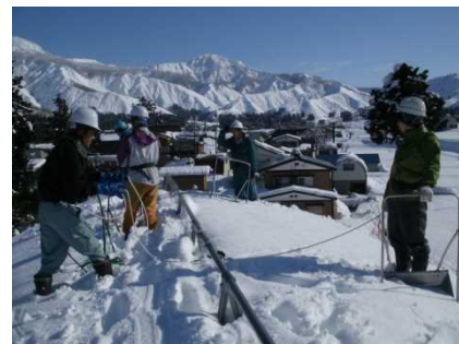
命綱固定アンカーの使用例