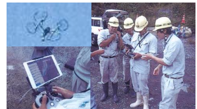
建設業のUAVによる地形計測