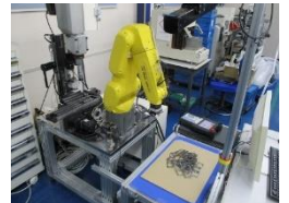
製造業のAIによるロボットピッキング